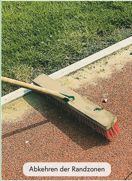
Abkehren der Randzonen