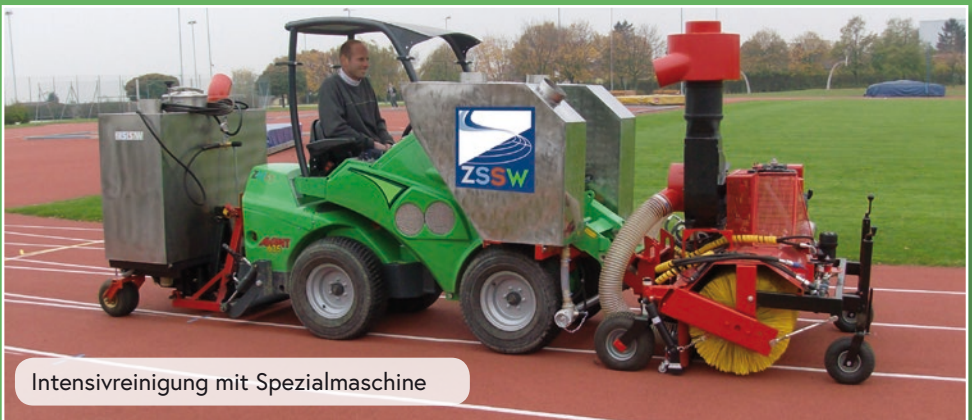
Intensivreinigung mit Spezialmaschine