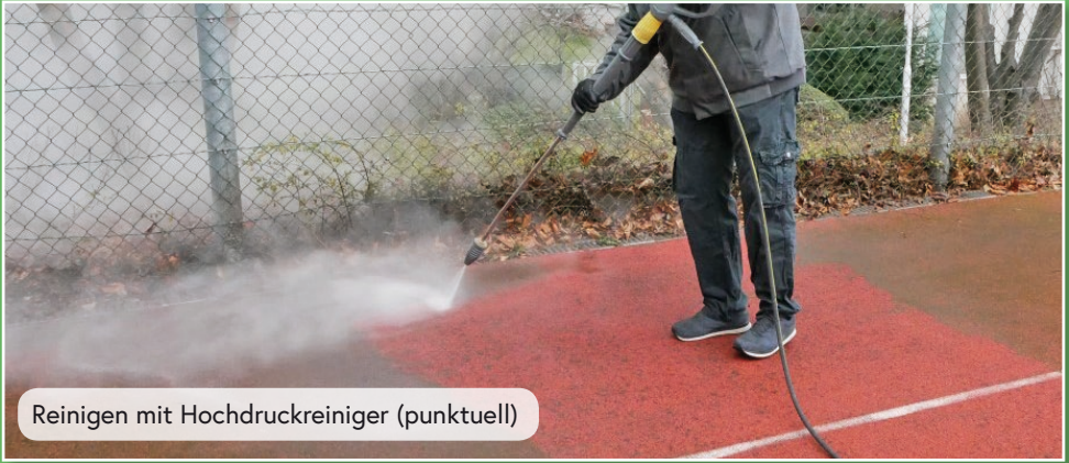
Reinigen mit Hochdruckreiniger (punktuell)