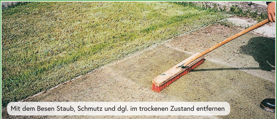
Mit dem Besen Staub, Schmutz und dgl. im trockenen Zustand entfernen