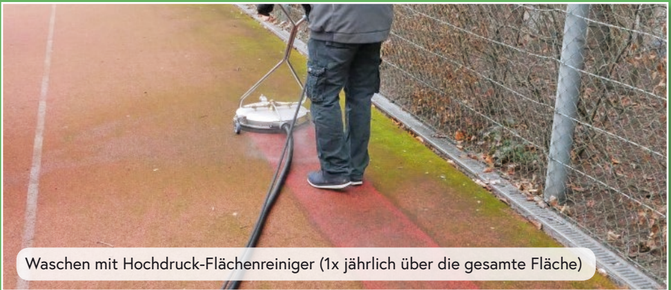
Waschen mit Hochdruck-Flächenreiniger (1x jährlich über die gesamte Fläche)