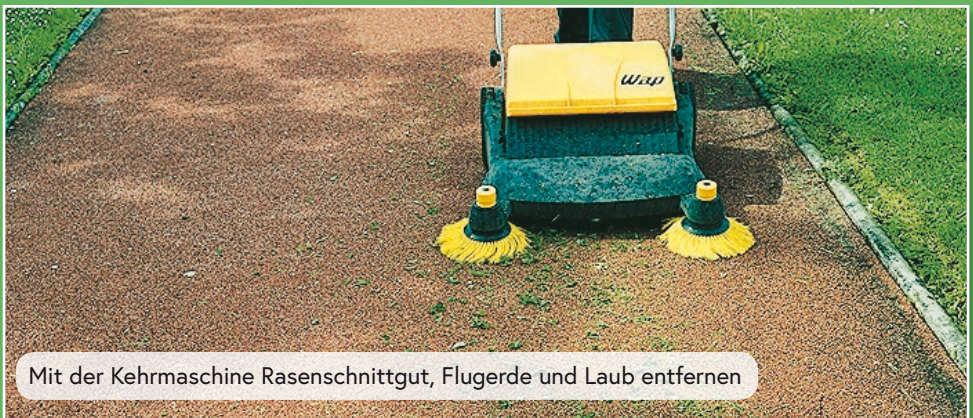
Mit der Kehrmaschine Rasenschnittgut, Flugerde und Laub entfernen