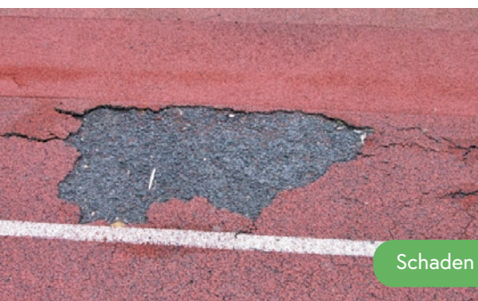
Schaden am Unterbau