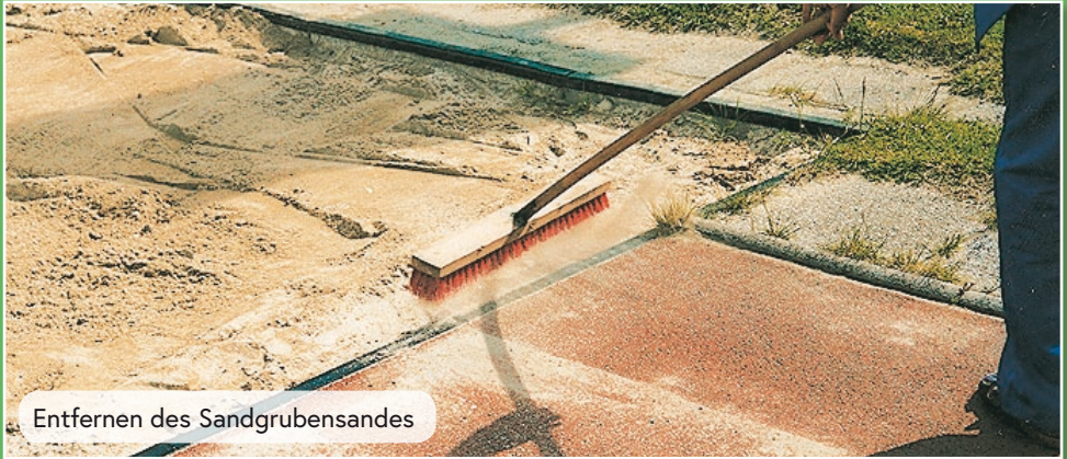
Entfernen des Sandgrubensandes